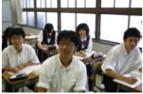
Q1 夏休みは受けたか Q2 何の教科を受けたか Q3 セミは楽しかったか

1年生にとっては、高校生活にもすっかり慣れて毎日生活しているのではないのでしょうか。2年生の皆さんは、夏休みの間に訪問した大学を通して自分の進学先を絞り込むことが出来たのではないのでしょうか。まだ進学についてイメージがわかない人は、少し焦る必要があるかもしれません。