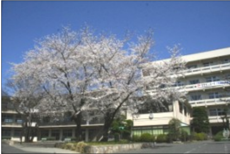
新入生の皆さん、ご入学おめでとうございます。県内国公私立高校二〇一校中から山村学園を「選択」した、県内中学校数約四四八校中から一三八校、県外十二校から県内中学生約六万六千人中の四九〇人が集うことができた。凄く確率であり、強い「縁」を感じませんか。

義務教育の九年間は、国民として生活する上で必要とする基礎を身につけたという事です。陶芸で言えば粘土をこね、形を作り素焼きの状態です。それをどのように仕上げ上げるか、コップなのか、お皿なのか何を注ぐのか、何を盛るのか、自分で判断し次の作業に取りかかってください。自分は今、何をしたいのか何をしたらいいのかを知ること